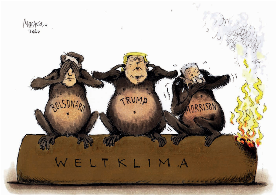
Bewegung unter den Klimawandelleugnern

auch der mehr oder weniger bereitwillige Schulterchluss mit demokratie- und minderheitenfeindlichen, häufig auch rechtsextremen Akteur*innen (Forchtner 2020; Kotsev/Nietfeld 2020) deuten auf eine Gemeinsamkeit hin: ein grundlegendes Unbehagen, das sich in Reaktion auf externe Erschütterungen immer wieder Bahn bricht (van Prooijen 2020: 16 ff.). Im Folgenden beleuchten wir Argumentationsmuster, Eigenschaften und Einstellungen von Klimawandelleugner*innen und diskutieren Möglichkeiten, mit ihnen in Dialog zu treten. Wir ergänzen diese Ausführungen zuweilen um – in Ermangelung umfassender wissenschaftlicher Auswertungen weitgehend anekdotische – Beobachtungen der Corona-Demonstrationen und ihres Umfelds im Frühjahr und Sommer 2020.